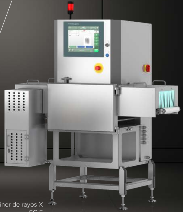
Escáner de rayos X SC-E

WIPOTEC OCS WEIGHING AND INSPECTION SOLUTIONS