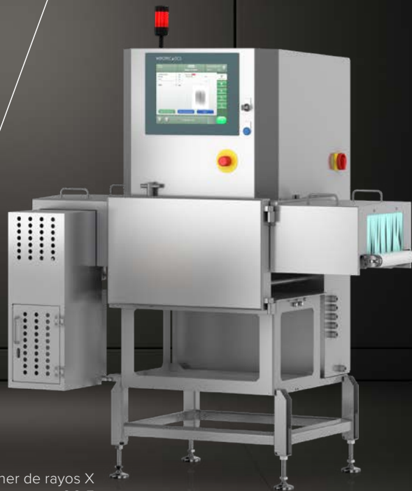
Escáner de rayos X SC-E

WIPOTEC OCS WEIGHING AND INSPECTION SOLUTIONS